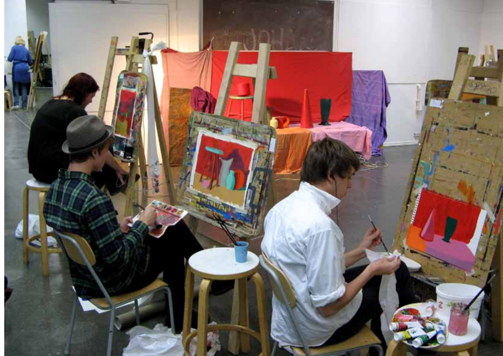
Färgövning med hjälp av stilleben.

Textil Vi utforskar det textila materialets spännvidd genom både två- och tredimensionella arbeten. Vi prövar tekniker som t.ex collage, textiltryck och broderi. Vi arbetar också med idé- och formexperiment för att nå ett personligt uttryck.